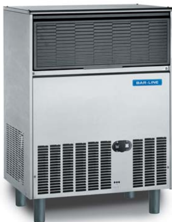
B 9040 AS/WS

Kostkarki do lodu Bar Line to nowa seria urządzeń wytwarzanych we włoskim zakładzie produkcyjnym Frimont Spa. Maszyny posiadają Certyfikat ISO 9001, wykonane są z odpornej stali nierdzewnej, posiadają wyprodukowane w Europie komponenty zapewniające najwyższą jakość i niezawodność. Każdy egzemplarz kostkarek Bar Line jest poddawany testom. Cechą charakterystyczną tej serii jest dobrze wyważona proporcja między wydajnością a pojemnością zbiornika, a także zmniejszone wymiary zewnętrzne, umożliwiające instalacje podblatowe czy w zabudowie. Kratki wentylacyjne z przodu obudowy zapewniają odpowiednią cyrkulację powietrza. Nowoczesny, elegancki design łączy użyteczność z niezawodnością wypracowaną w ciągu wielu lat doświadczenia w technologii produkcji lodu. Izolowany zbiornik na lód wraz z drzwiczkami minimalizują skraplanie się powietrza i tworzenie warstwy wody na powierzchniach urządzenia. Elektromechaniczne sterowanie zwiększa niezawodność i ułatwia proces naprawy urządzenia.