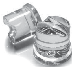
B 9040 AS / WS

B 2006, B 2508, B 3008, B 3015, B 4015, B5022, B 6022, B7540, B9550.