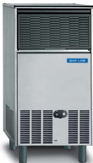
B 7540 AS/WS

Kostkarki do lodu Bar Line to nowa seria urządzeń wytwarzanych we włoskim zakładzie produkcyjnym Frimont Spa. Maszyny posiadają Certyfikat ISO 9001, wykonane są z odpornej stali nierdzewnej, posiadają wyprodukowane w Europie komponenty zapewniające najwyższą jakość i niezawodność. Każdy egzemplarz kostkarek Bar Line jest poddawany testom. Cechą charakterystyczną tej serii jest dobrze wyważona proporcja między wydajnością a pojemnością zbiornika, a także zmniejszone wymiary zewnętrzne, umożliwiające instalacje podblatowe czy w zabudowie. Kratki wentylacyjne z przodu obudowy zapewniają odpowiednią cyrkulację powietrza. Nowoczesny, elegancki design łączy użyteczność z niezawodnością wypracowaną w ciągu wielu lat doświadczenia w technologii produkcji lodu. Izolowany zbiornik na lód wraz z drzwiczkami minimalizują skraplanie się powietrza i tworzenie warstwy wody na powierzchniach urządzenia. Elektromechaniczne sterowanie zwiększa niezawodność i ułatwia proces naprawy urządzenia.